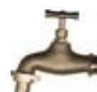
Robinet laiton à manette