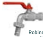
Robinet métal 1/4 de tour