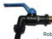
Robinet PE/fibre de verre 1/4 de tour