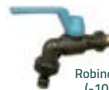
Robinet grand froid (-10°C). 1/4 de tour